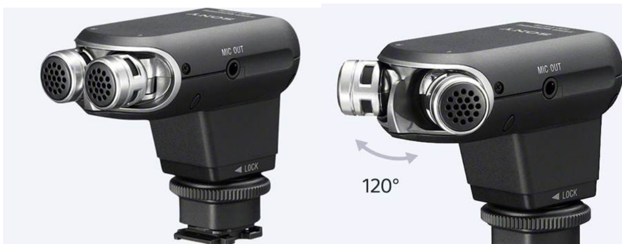
Sony XYST1M stereomikrofon til Multi Interface-tilbehørssko

Jeg er den lykkelige ejer af en Sony XYST1M mikrofon, som kan monteres i kameraets tilbehørssko. Hvis kameraet har en Sony Multi Interface tilbehørssko, behøves der ingen kabler – meget nemt og praktisk. Mikrofonen vejer kun 100 g, og man kan placere en ’død